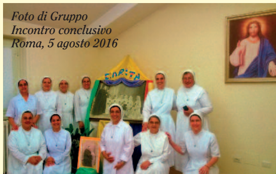
Foto di Gruppo Incontro conclusivo Roma, 5 agosto 2016