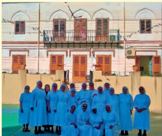
Il gruppo delle Formatrici dinanzi alla Casa Madre della Congregazione durante la visita ai luoghi di Madre Carmela - Palermo, 26- 30 luglio 2016

Ci rendiamo conto sempre più che il Carisma che ci è stato donato è vivo, operante, non possiamo soffocarlo con le logiche aziendali della produttività e del redditizio, il CARISMA è luce che illumina e amore che genera e feconda nella gratuità, nella generosità del dono di sé ai picco-