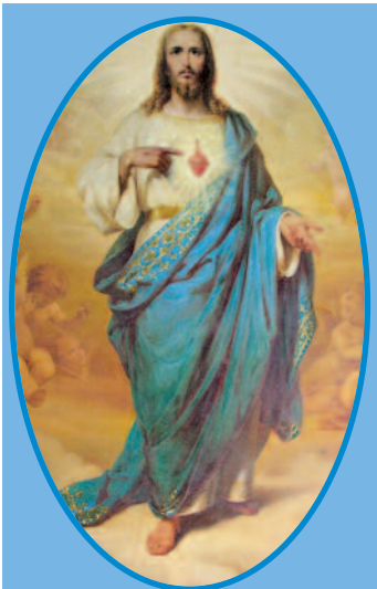
Immagine del Sacro Cuore di Gesù dipinta su tela posta dietro l'altare maggiore della Cappella della Casa Generalizia delle Suore del Sacro Cuore del Verbo Incarnato in Roma.

“Il Sacro Cuore è quella fonte divina da cui scaturisce quell'acqua salutare che toglie la sete in eterno”